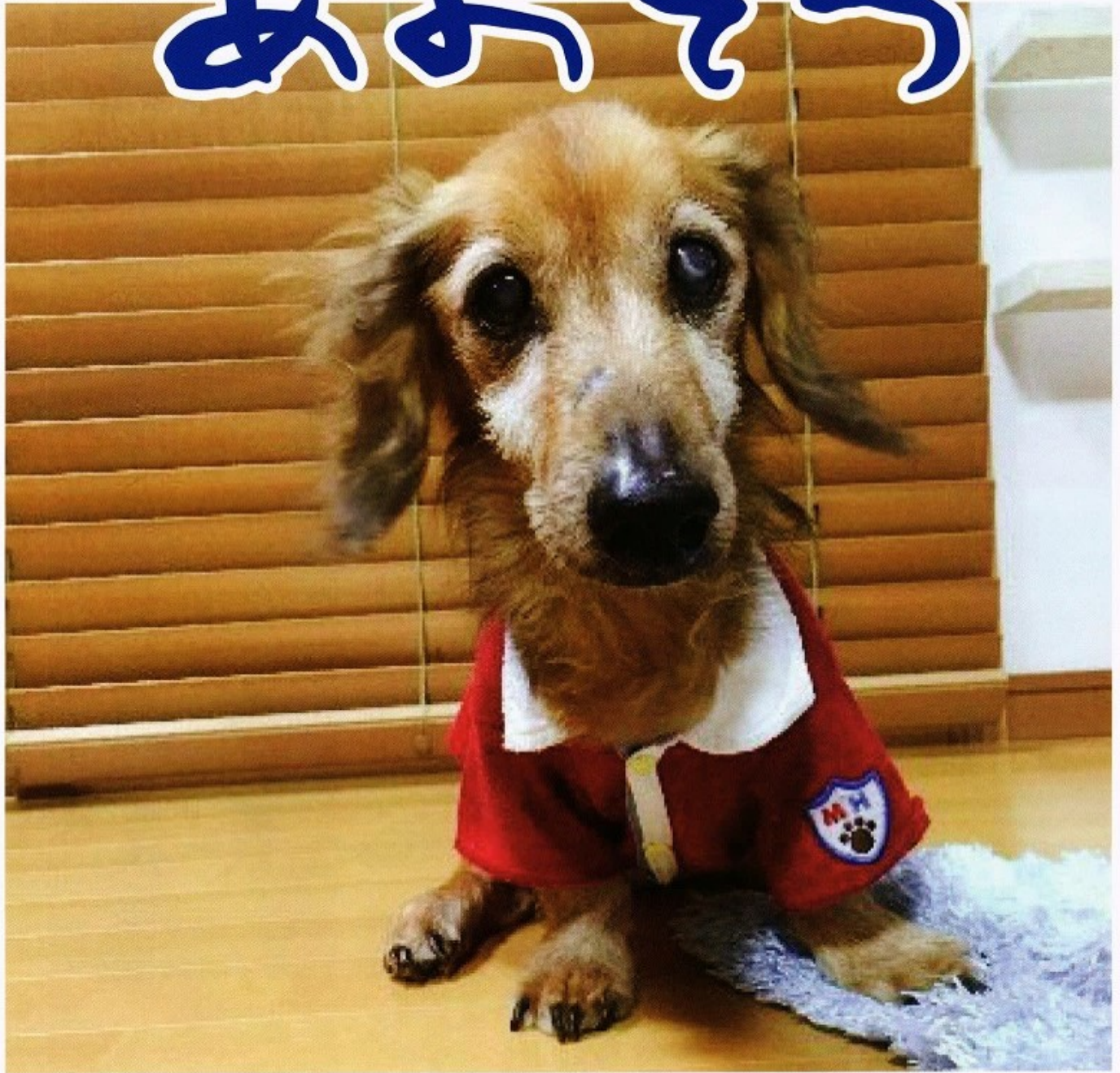
石川プリン君